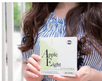
「Apple Eight」1箱で林檎エキス660個分。