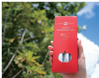
「Appleゼリー」1包で林檎6個分。